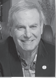
Juge Theodore Tax, Cour provinciale de la Nouvelle-Écosse