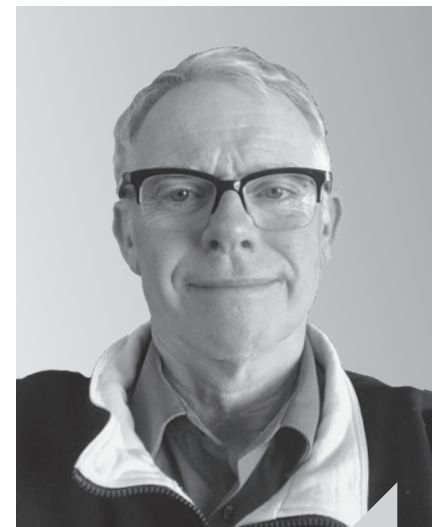
Judge Ross Green

Judge Ross Green, Provincial Court of Saskatchewan