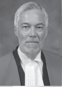
Juge Patrick Choquette, Cour du Québec Chambre civile