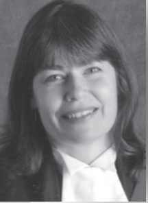
Juge Kathleen Caldwell, Cour de justice de l'Ontario