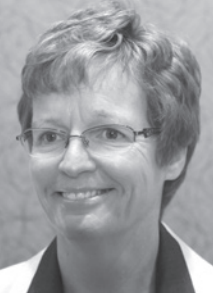
Juge en chef Nancy Orr, Cour provinciale de l'Île-du-Prince- Édouard

Nous avons été effectivement coupés du continent lorsque l'Île-du-Prince-Édouard a déclaré l'état d'urgence sanitaire le 16 mars 2020 et a totalement fermé ses frontières, sauf pour les services essentiels. Un tee-shirt de l'époque montrait le ministre des Transports déclarant We'll make you turn yer rig right around (nous vous ferons faire demi-tour tout de suite), sur photo du pont de la Confédération en arrière-plan. C'est ainsi que la COVID-19 a commencé à toucher l'Île-du-Prince-Édouard.