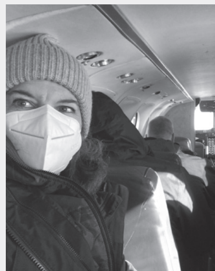
On the airplane, going to court

COVID-19 has also brought home to us rather starkly that as human beings, we often adopt many important mantles. Stress is an inevitable consequence. More than ever, we need to be kind to ourselves and take care. ▀