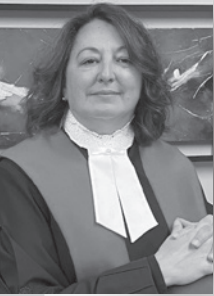
Juge Claire Desgens, Cour du Québec Chambre criminelle

La pandémie n'a pas freiné la commission d'infractions criminelles au Québec, au contraire, de nouveaux dossiers affluent toujours dans nos salles de cours.