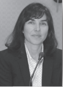
Juge Elizabeth Buckle, Cour provinciale de Nouvelle-Écosse