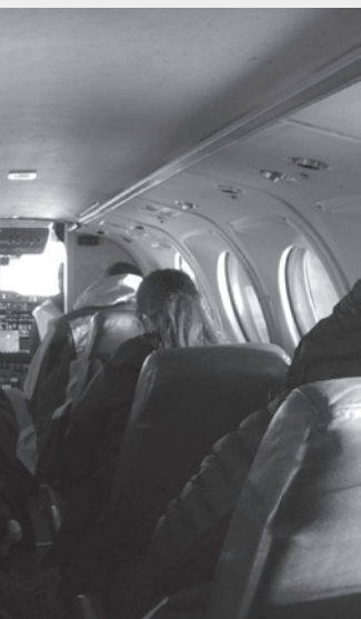
Dans l'avion, en direction de la cour

La COVID-19 nous a également rappelé de manière saisissante qu'en tant qu'êtres humains, nous assumons souvent de nombreux rôles importants. Le stress est une conséquence inévitable. Plus que jamais, nous devons nous ménager et prendre soin de nous. ▽