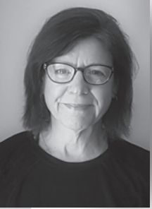
Juge Katherine McLeod Cour de justice de l'Ontario