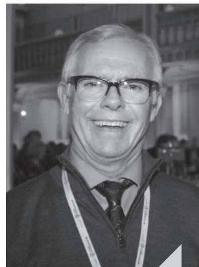
Judge Ross Green

Judge Ross Green, Provincial Court of Saskatchewan