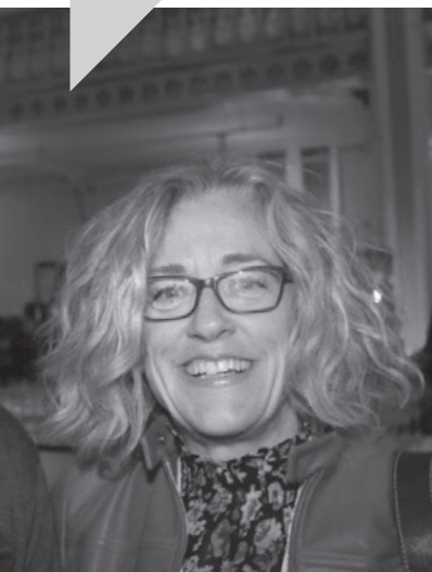
Juge Martine Nolin

Cette édition du Journal des juges provinciaux met en relief les ateliers de formation offerts dans le cadre du Congrès 2018 de l'ACJCP tenu de façon concomitantes avec le Colloque annuel de la Cour du Québec. Les sujets présentés avec animation et compétence abordaient différents enjeux soulevés par l'épineuse mais nécessaire réflexion sur l'éthique et la déontologie judiciaire; sujet d'actualité s'il en est.