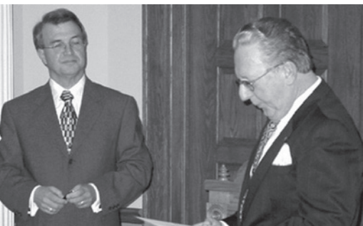
On his appointment at Newfoundland and Labrador's first Child and Youth Advocate in September 2002 (as published in The Telegram)

While in Botwood, he also helped raise the money for the construction of the recreation complex and the swimming pool.