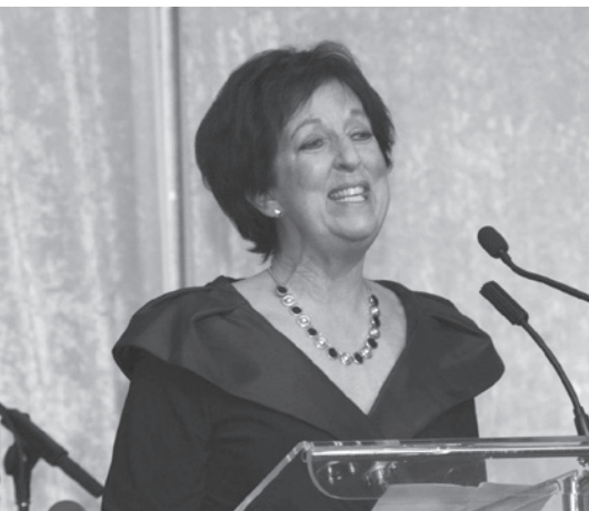
Judge Odette Perron Juge Odette Perron