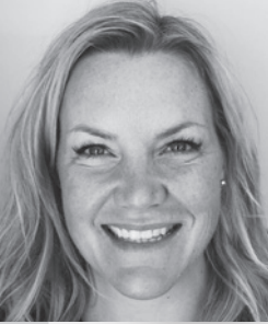
Juge Mélanie Roy Cour du Québec