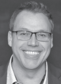
Juge Marco LaBrie Cour du Québec