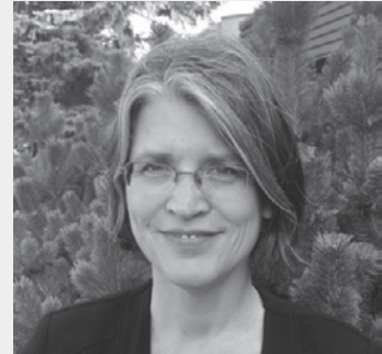
Judge Christine Harapiak

Judge Harapiak shared with us some examples of improper social media use by judges who unfortunately even ended up in the news.