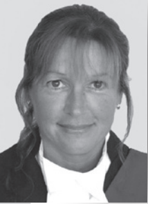
Juge Karen L. Lische Cour de justice de l'Ontario