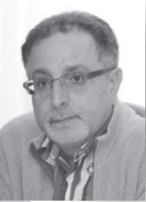
Juge Joseph De Filippis Cour de justice de l'Ontario