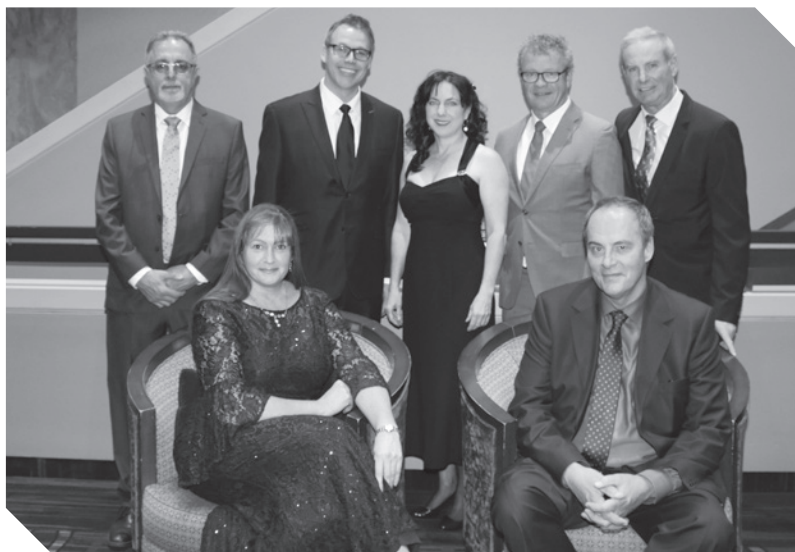
CAPCJ executive for 2017-2018